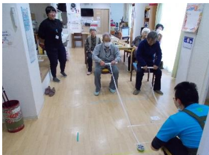
▲糸巻きゲーム！どちらが早いかな？

最近はレクリエーションの時間に来てくれるボランティアさんも少しずつ増え、大変助かっています。皆さんもぜひ、遊びに来てくださいね！