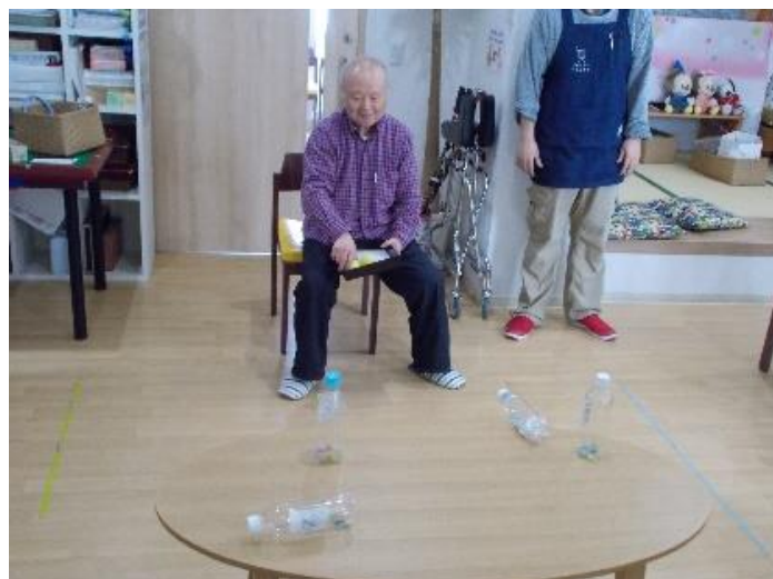
▲ボール投げボウリング？ 点数のついた的にボールをあてて倒します

次は運動系レクリエーションです。こちらもたくさんの内容を日々考案していますが、最近「糸巻きゲーム」を行ったところ、大変好評でした。糸巻きゲームは筒に2mほどの紐をつけて、筒をクルクルまわして紐を巻き取り、先端についている重りをできるだけ早く手繰り寄せる遊びです。筒をクルクルまわす動きは普段なかなか動かすことのない筋肉を使うので、