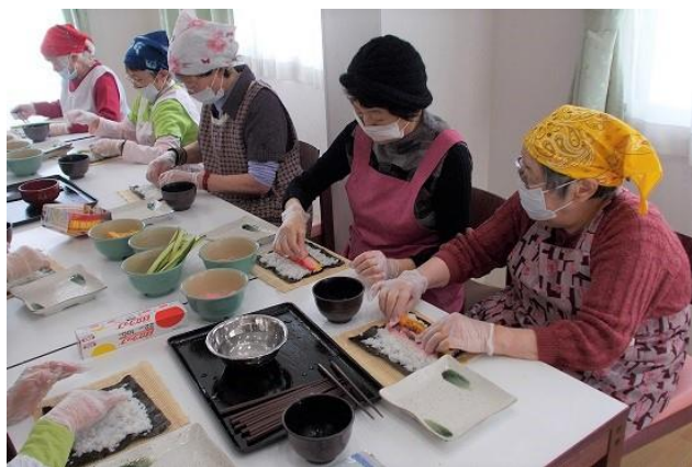
▲2月1日は恵方巻きをつくりました 季節を感じる行事にも取り組んでいきます

お部屋を訪問して、家主に時計が鳴っていることをお伝えし、音を消し止めました。家主は気づかなかつたと驚かれ、「教えてくれてありがとう」とおっしゃっていました。そんな小さな当たり前のことだったのですが、家主は他のスタッフに嬉しそうにそのことを話していたようで、こうした何気ない毎日の関わりがとても大切だと感じますし、それを“手話”で行なえる環境が何より必要だと思います。“自分を気にかけてくれている”“困ったときはすぐに頼める”とっていただくことが大切だと意識しながら、日々皆さんと関わっています。