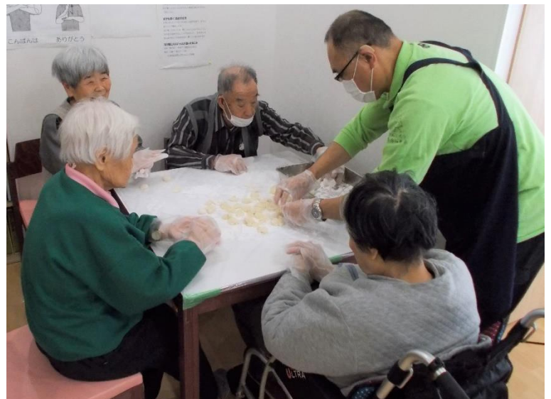
▲ついたお餅を丸めます