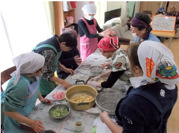
▲男性も女性も みんなで料理は楽しいです

年越しに向けて、お餅もつくりました。鏡餅に、雑煮や汁粉用のお餅、大福餅も。つきたてのお餅は格別です！