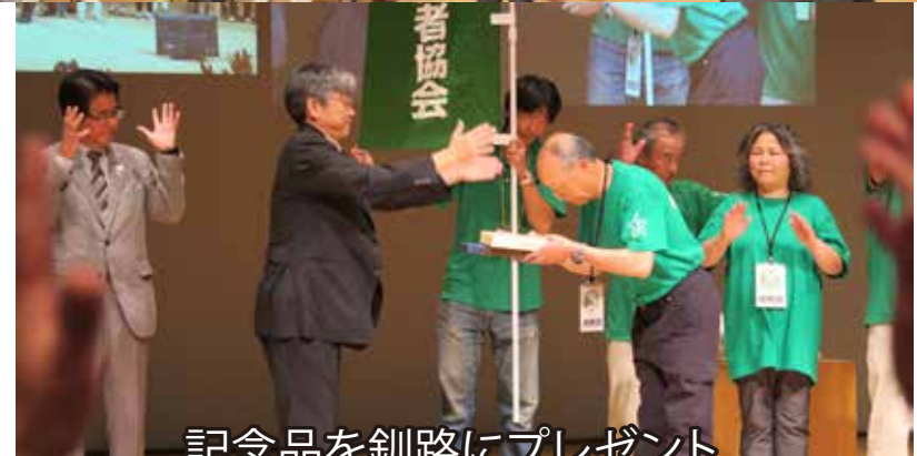
記念品を釧路にプレゼント