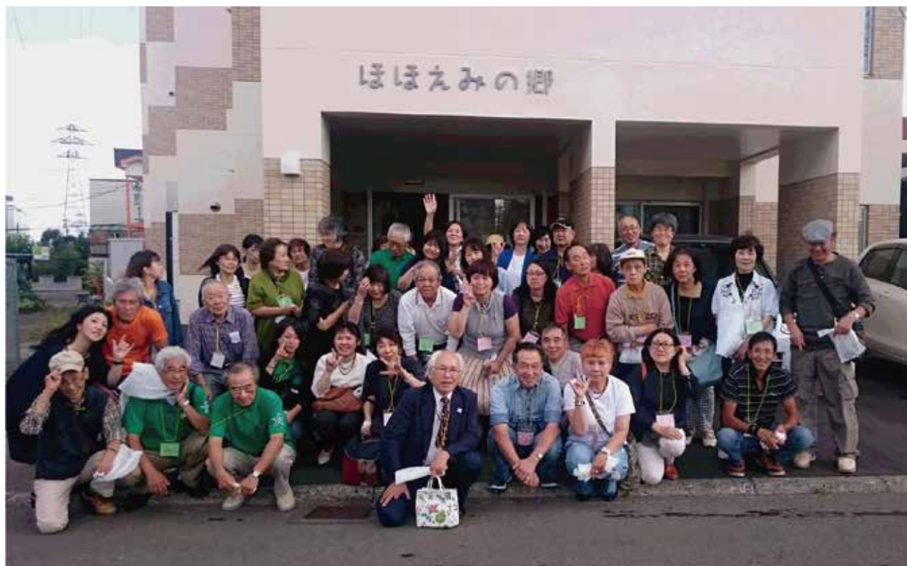
～ほほえみの郷で記念写真～